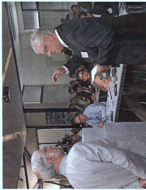
Lebhafte Fachdiskussion während des dtm-netforums